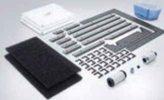
Abbildung: Wartungskit CTX 410