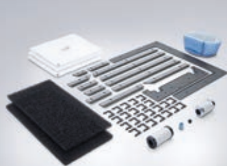
Abbildung: Wartungskit CTX 410